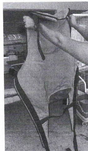
cesto para guincho