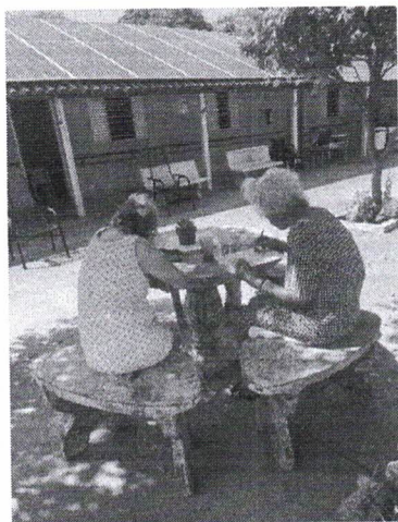
Mesa redonda p/ área externa

Fotos dos equipamentos/materiais recebidos no mês de Setembro/24