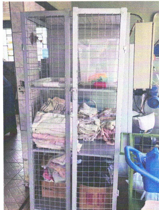
Carrinho tipo armário com rodas