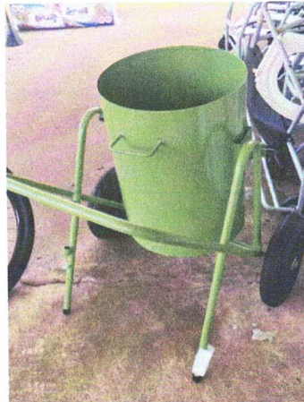
carrinho coleta de lixo