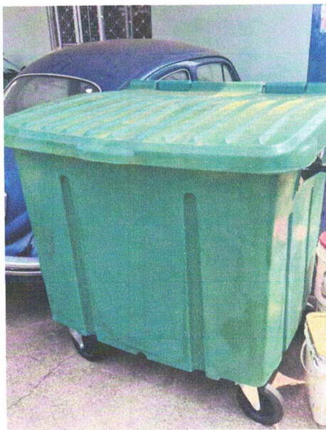
Contêiner urbano / lixeira