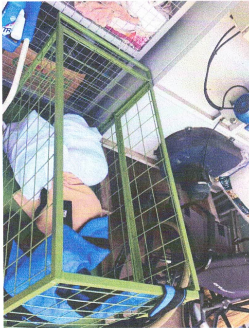
carrinho caixa para 400kg

Contato: (17) 3542-1935 (17) 3543 – 1436 E-mail: lardevelhicesmss@vivointernetdiscada.com.br